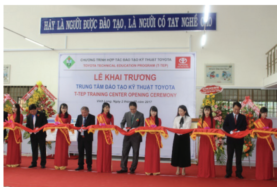
Hình 4. TOYOTA Việt Nam đầu tư thiết bị cho nhà trường

Ở các nước phát triển, cụ thể như ở Cộng hòa liên bang Đức, DN đầu tư cho quá trình đào tạo là việc bắt buộc phải làm bằng nhiều hình thức khác nhau. Một chiếc ô tô mới sản xuất bắt buộc phải đưa vào cơ sở đào tạo (CSĐT) để phục vụ cho hoạt động đào tạo trước khi chiếc xe đó được lưu hành trên thị trường, ... để khi chiếc xe đó bị hư hỏng còn có thợ có tay nghề sửa chữa, ... và ngược lại, khi đánh giá kết quả học tập của người học, ngoài điểm số do Thầy, Cô giáo đánh giá còn có điểm đánh giá của DN. Đối với người học, bắt buộc