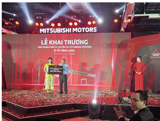
Hình 5. Công ty MITSUBISHI trao học bổng khuyến khích

Ở Việt Nam hiện nay, việc kêu gọi DN đầu tư vào trường học là việc làm còn mới mẻ và rất ít DN tham gia. Tuy nhiên cũng có nhiều CSĐT có uy tín đã được DN đầu tư trang thiết bị, trao học bổng khuyến khích cho SV một cách tự nguyện để góp phần phối hợp cùng nhà trường trong quá trình đào tạo, để cuối cùng xã hội có được lực lượng lao động qua đào tạo đáp ứng nhu cầu của thị trường lao động, phát triển đất nước nhưng số lượng DN đầu tư chưa nhiều cũng như CSĐT nhận được tài trợ còn khiêm tốn.