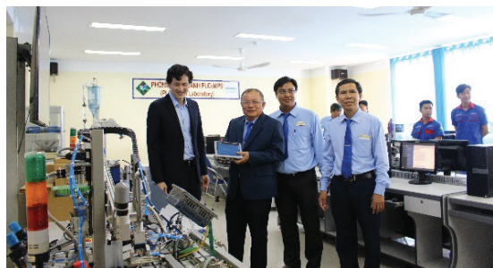
Hình 3. Doanh nghiệp đầu tư thiết bị cho nhà trường

Một khi nhà trường làm tốt vai trò kết nối DN, tổ chức TTSX đúng chuyên môn tại DN cho SV thì kiến thức và kỹ năng mà đội ngũ cán bộ giảng dạy đã trang bị cho SV được thể hiện một cách thiết thực nhất, chất lượng đào tạo của nhà trường được đánh giá một cách khách quan và chính xác nhất giúp cho uy tín và thương hiệu của trường ngày càng tăng.