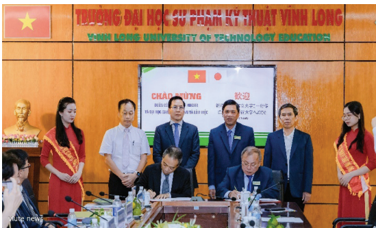
Hình 6. Lễ ký kết hợp đồng chương trình thực tập chuyên ngành ngoài nước

2023, VLUTE đã xây dựng CTĐT theo hướng linh hoạt cho phép SV được TT SX tại các DN ngoài nước, thời gian thực tập có thể kéo dài tối đa đến 12 tháng và đặc biệt SV được DN hỗ trợ nhiều khoảng chi phí lớn như vé máy bay khứ hồi, chỗ ở, huấn luyện kỹ năng mềm, an toàn lao động, bảo hiểm, ... dành cho SV đủ điều kiện. Nếu trong thời gian thực tập, SV thể hiện tốt năng lực và phẩm chất nghề nghiệp sẽ được các DN tiếp tục hợp đồng lao động dài hạn tại nước sở tại.