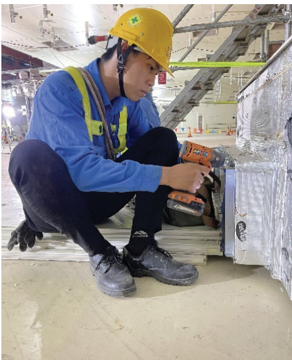
Hình 1. Sinh viên thực tập tại Doanh nghiệp

Ban đầu, việc tìm DN phù hợp cho sinh thực tập gặp nhiều khó khăn bởi lúc đó chưa có nhiều DN như ngày nay, chi phí phát sinh trong quá trình thực tập tại DN cũng gây ảnh hưởng không nhỏ và quan trọng nhất là DN chưa yên tâm giao công việc cho SV thực tập vì sợ SV không làm được theo yêu cầu tại DN.